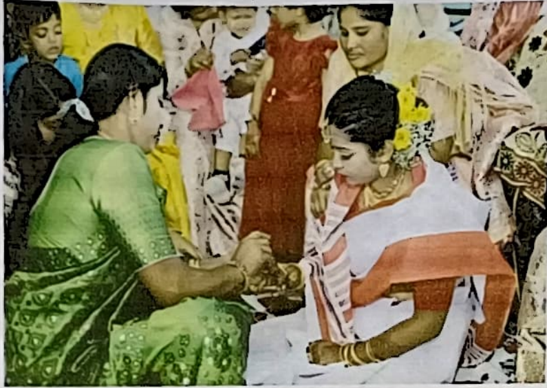
চিত্র ১: শ্রদ্ধাশ্রম বঁধন লোক অকলৰ জোৰণৰ সময়ৰ সঁজুলি