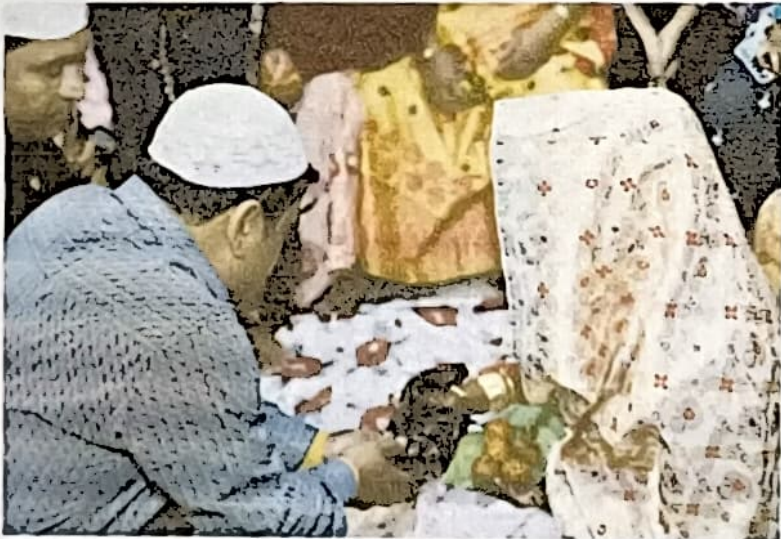
চিত্র ২: শ্রদ্ধাশ্রম বঁধন লোক অকলৰ বিকাসৰ সময়ৰ সঁজুলি