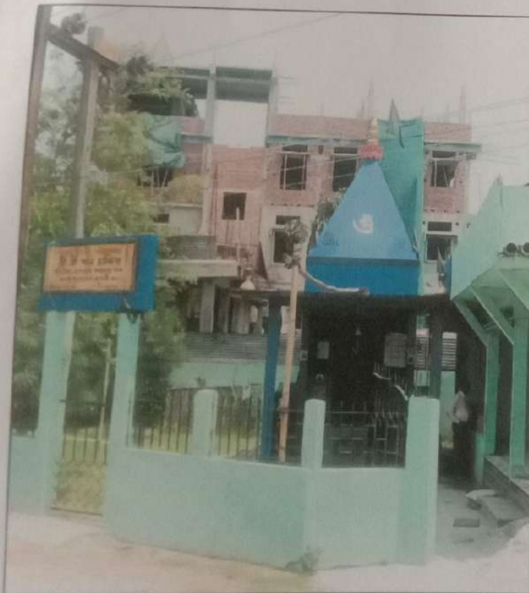
চিত্র নং ৭ → জাপাৰকুছি মনি মন্দিৰ