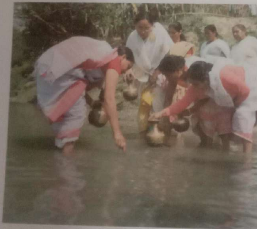
চিত্র নং ৫ → পাতী তোলো পৰ্ব