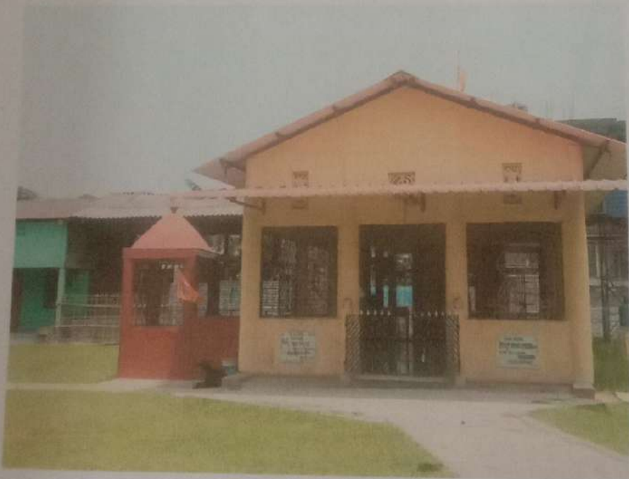
ଚିତ୍ର ନଂ -> ୨ ଜାମ୍ବାବକୁଛି ଶିବାଶ୍ରମର ସ୍କୁଲ ଯନ୍ତ୍ର