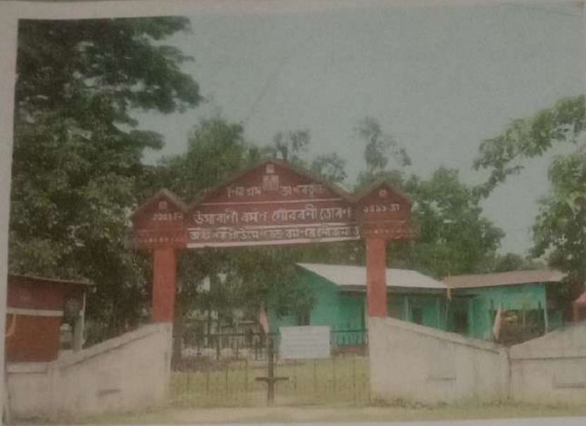
ଚିତ୍ର ନଂ -> ୧ ଜାମ୍ବାବକୁଛି ମାଟ୍ଟର ଶିବାଶ୍ରମର ସ୍କୁଲ ଶୋଠନ