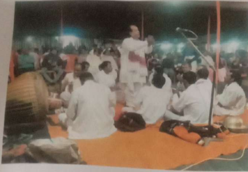
চিত্র নং ৬ → নাগাৰা নাম পাঠিয়েকন