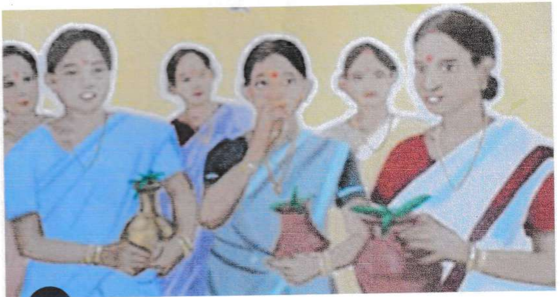
ଚିତ୍ର ନଂ - ୫ ଆତ୍ମନିୟମ ବିକାଶୀତ