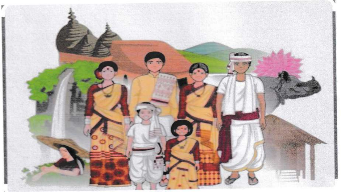
ଚିତ୍ର ନଂ - ୪ ଆତ୍ମନିୟମ ଲୋକ - ଆସିତ୍ୟ