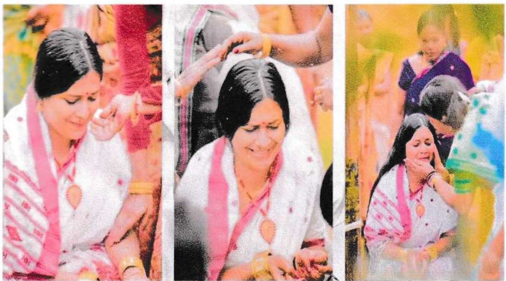
চিত্র নং - ২