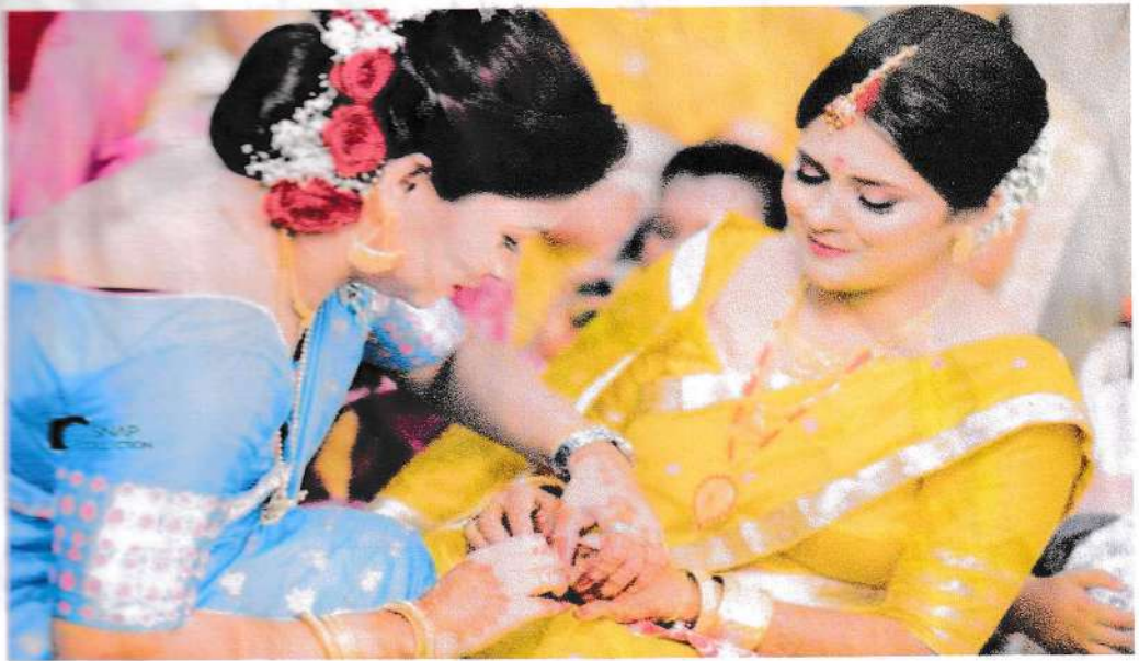
চিত্র নং - ১