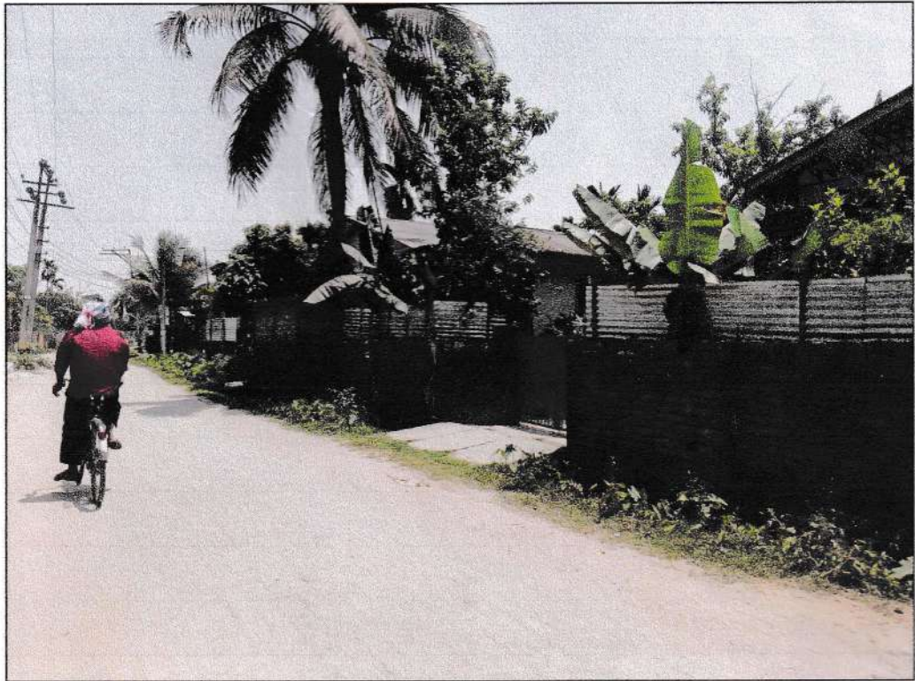
চিত্র নং ২: বগজিপাড়া উচ্চলব এটি আলোকচিত্র.