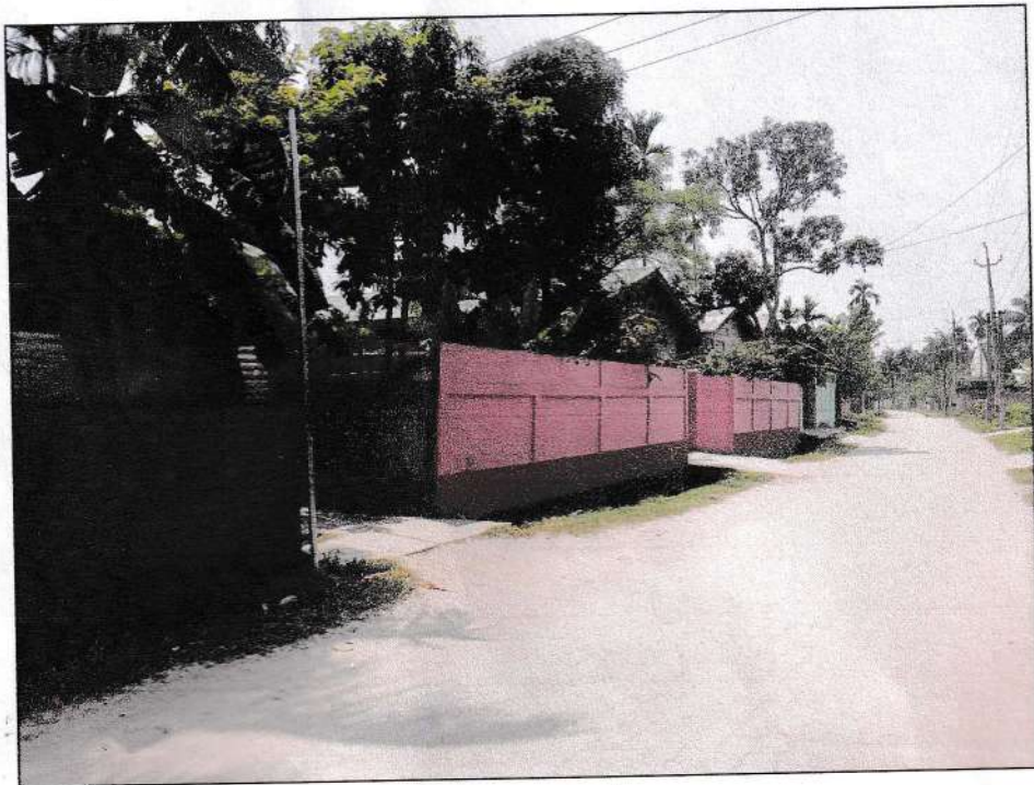
চিত্রনং ৪: কাঞ্জিনাথা অঞ্চল' এটি আলোকচিত্র