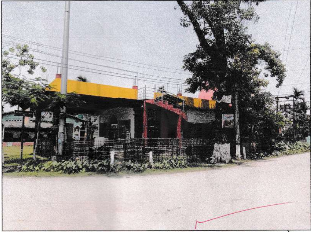
চিত্র নং ১: কাজিপাড়া শ্রী শ্রী বাসুদেব মন্দির এটি আলোকচিত্র