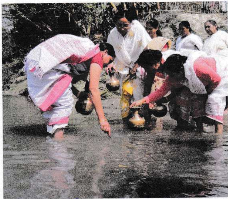
চিত্র নং-০৫ লালী জেলা