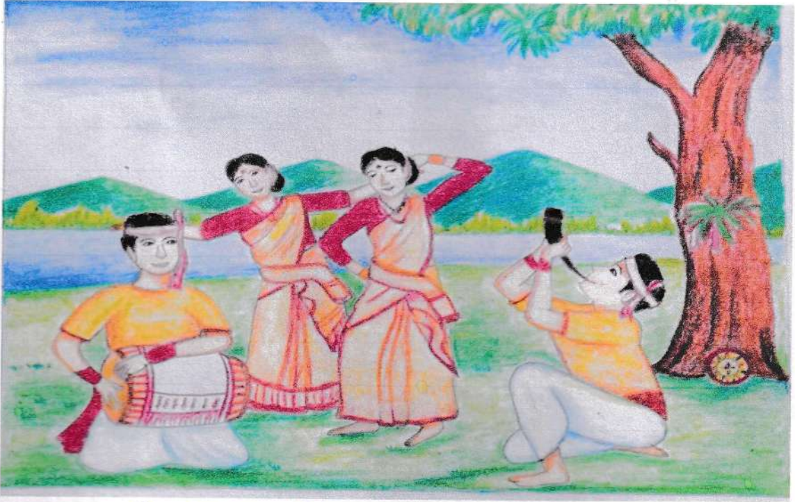
চিত্র নং ১-বিন্দু নৃত্য