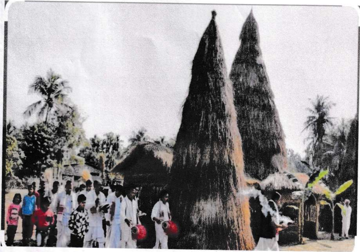
চিত্র নং ৩ - স্নেহি জ্বলোৱাৰ আগৰ দৃশ্য